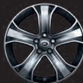
20"-LEICHTMETALLFELGE MIT 5 SPEICHEN IN DIAMOND TURNED FINISH

Bitte beachten Sie: Bei der Wahl optionaler Felgen-Reifen-Kombinationen oder von Sondergrößen sollten Sie an den geplanten Einsatzzweck des Fahrzeugs denken. Größere Reifen und Niederquerschnittsreifen bieten zwar Vorteile bei Design oder Handling, sind aber empfindlicher gegenüber Schäden. Besprechen Sie Ihre Anforderungen mit Ihrem Händler, wenn Sie Ihr Fahrzeug zusammenstellen.