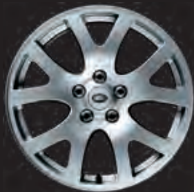
19"-LEICHTMETALLFELGE MIT 5 V-SPEICHEN