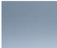
IZMIR BLUE (METALLIC)