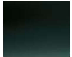
GALWAY GREEN (METALLIC)