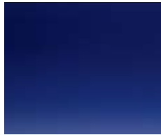
BALI BLUE (METALLIC)