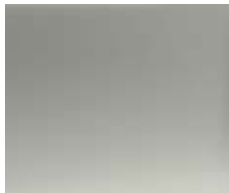
IPANEMA SAND (METALLIC)