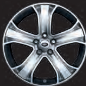
20"-LEICHTMETALLFELGE MIT 5 SPEICHEN