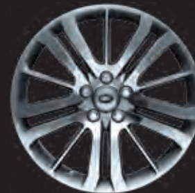
20"-LEICHTMETALLFELGE MIT 15 SPEICHEN IN DIAMOND TURNED FINISH