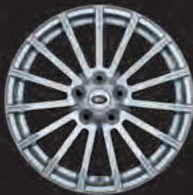
19"-LEICHTMETALLFELGE MIT 15 SPEICHEN