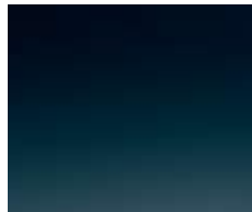
LUGANO TEAL (METALLIC)*