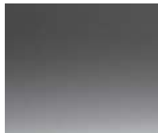
STORNOWAY GREY (METALLIC)