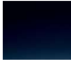
BUCKINGHAM BLUE (METALLIC)