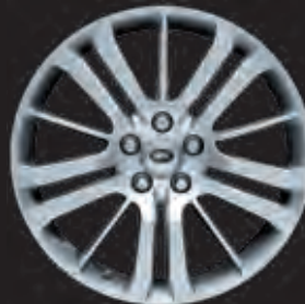
20"-LEICHTMETALLFELGE MIT 15 SPEICHEN