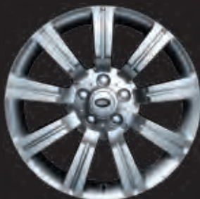
20"-LEICHTMETALLFELGE MIT 9 SPEICHEN IN STORMER DESIGN